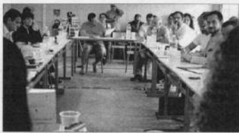
Una de les aules en l'edició de l'any passat.