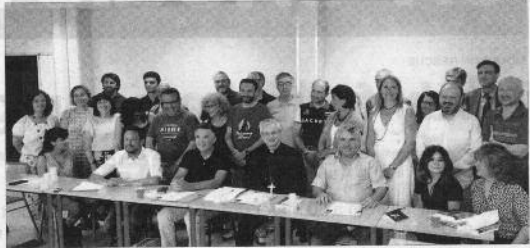
Participants at the Catalan Summer University around co-Prince and bishop Joan Enric Vives.