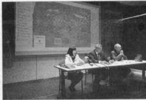
La Diada andorrana es van presentar ahir a FEDA.

isme andorrà. Les ponències estan presentades per polítics, historiadors i analistes amb l'objectiu de "sumar reflexions". D'altra banda, es va presentar el llibre de la jornada de l'any passat, Andorra i l'acord d'associació amb la Unió Europea , una publicació de la SAC, que compta amb la col·laboració del Govern FEDA.