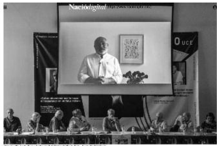
Una foto que es pot veure al programa d'Estiu online d'Estiu de la Universitat Catalana d'Estiu.