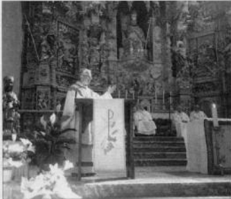
Missa de Joan-Enric Vives. Va ser el primer cop que el Copríncep episcopal va oficiar una missa a la Diada.