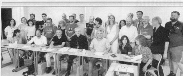
Vives amb els ponents i assistents de la Diada Andorrana de Prada.

El parlamentari alerta que aquest model té com a conseqüència enfrontaments parlamentaris continus, que es governi sense arribar a acords sobre