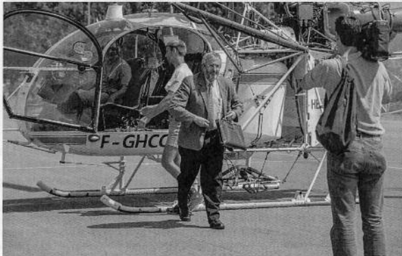
El racó del record El cap del Govern d'Andorra Marc Forné surt de l'helicòpter que havia aterrat a la pista d'atletisme del Campus. Era l'any 1997.