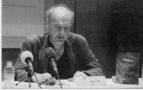
La presentació de la 31a Diada andorrana a l'UCE i del llibre de l'any passat.