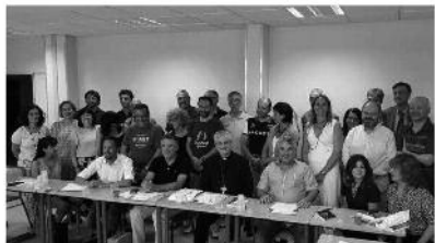
L'arquebisbe d'Urgell i copríncep d'Andorra, Joan-Enric Vives, a la Universitat Catalana d'Estiu a l'Hotel d'Urgell

19/08/2018 | 13:30