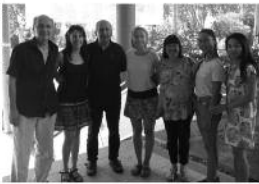
Estudiants becaris i membres de la SAC