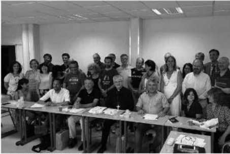
L'Arquebisbe d'Urgell i Copríncep d'Andorra, Joan Enric Vives, a la Universitat Catalana d'Estiu