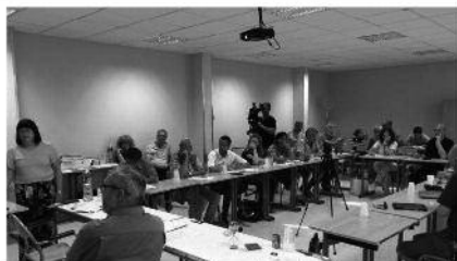
Un moment de la jornada sobre el parlamentariisme andorrà.

ANA ANDORRA | A VELLA | 18/08/2018 (6/2)