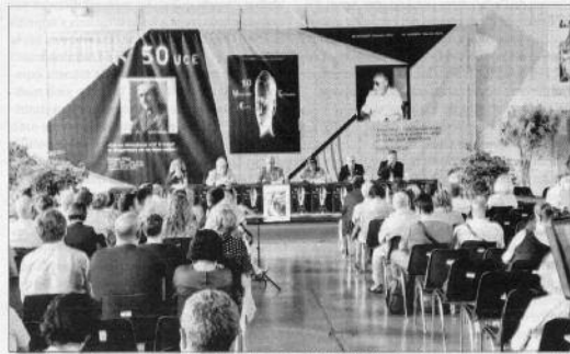
Una de les xerrades que es van celebrar durant inauguració de l'UCE ahir a Prada.

El conseller general d'SDP Victor Naudi, alerta dels riscos que poden afectar el funcionament democràtic d'Andorra. El parlamentari apunta com a "factor determinant" la corrupció, tot i que admet que "difícilment es poden produir casos de certa reivindicació" per la dimensió del país i també el fet de ser un Estat petit i per tant més vulnerable. Per a Naudi, el factor desestabilitzador més important del país va ser la nota de la FICGCH, sobre la qual afirma que encara hi ha incògnites. El polític també destaca el pes del sector financer i la indústria tabaquera sobre l'economia, fet que «diu» ha fet que aquests sectors "s'hagin beneficiat de certa immunitat legislativa". Per això, considera que cal diversificar l'economia i evitar els monopòlis i la dependència. En aquest sentit, opta per "coniar un equilibri de forces més separat" i apunta per reforçar la representativitat del parlament reformant la llei electoral amb un sistema de llista única nacional i demana legalitzar l'avortament.