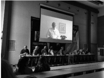
Una imatge de la taula rodona durant la salutació del conseller Puig

per Quico Salicrú (Prada, el Conflent) 17/08/2018 19:03 | Actualitzat a 17/08/2018 21:22