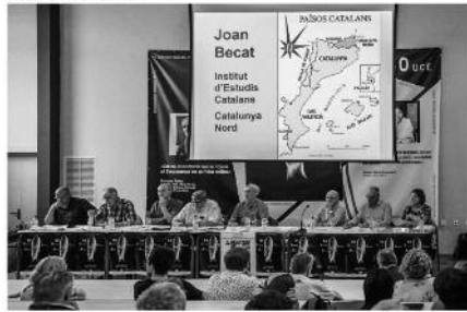
"Països Catalans mite o realitat", així ha titulat la Universitat Catalana d'Estiu una de les primeres jornades rodones i debatides a Prada del Conflent. Una foto que es pot veure al programa d'Estiu online d'Estiu de la Universitat Catalana d'Estiu.

per Quico Salicrú (Prada, el Conflent) 17/08/2018 19:03 | Actualitzat a 17/08/2018 21:22