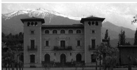
La UCE 2018 s'ha desdoblada entre Prada de Conflent, seu original, i el Campus de Manresa a principis de juliol

La Universitat Catalana d'Estiu (UCE) assolix enguany la 50a edició. Per celebrar el mig segle de vida (1968 – 2018), l'organització va decidir desdoblada la programació a dues seus. Després d'haver celebrat a principis de juliol el Campus de Manresa, tornarà a Prada de Conflent –el seu emplaçament habitual– entre el 17 i 23 d'agost. Fidels a l'esperit que ha caracteritzat històricament la UCE, els alumnes podran assistir a jornades, seminaris i tallers de pràcticament tot l'espectre acadèmic: literatura, lingüística, sanitat, tecnologia, economia, ciències polítiques, filosofia, i moltes més branques de coneixement